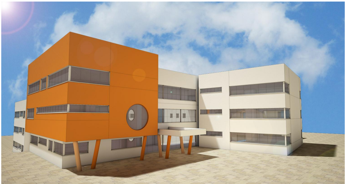
ביה"ס "הלל צור" בצפון העיר- הדמייה