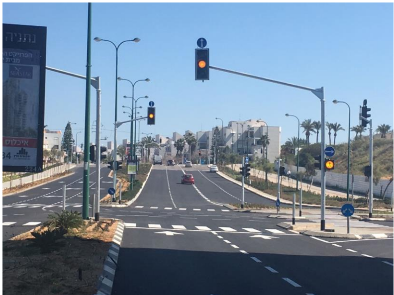
חניכת רמזור בני ברמן – עיר ימים