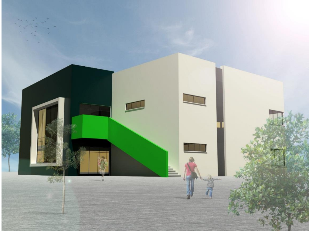
מרכז קהילתי (צפון העיר) – הדמייה