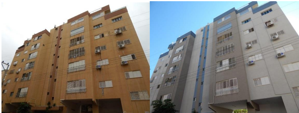
שיפוץ חזיתות – רחוב הלפרין 18 (לפני ואחרי השיפוץ)