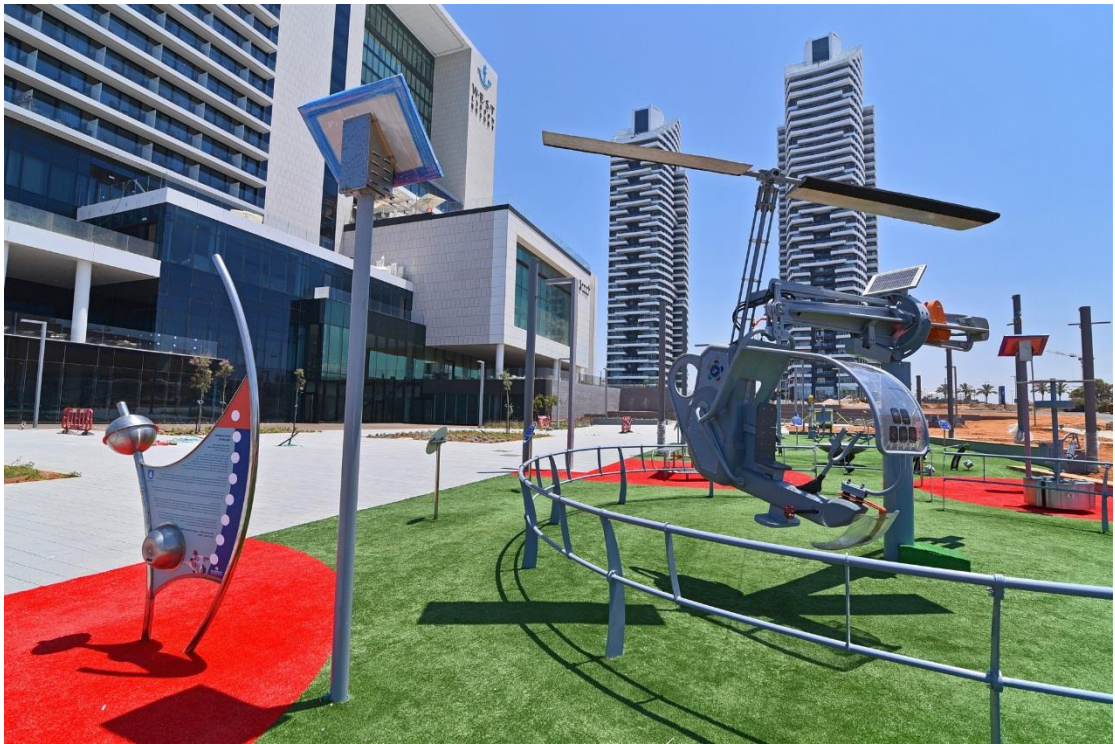
גן מדעי בשכונת נוף טיילת