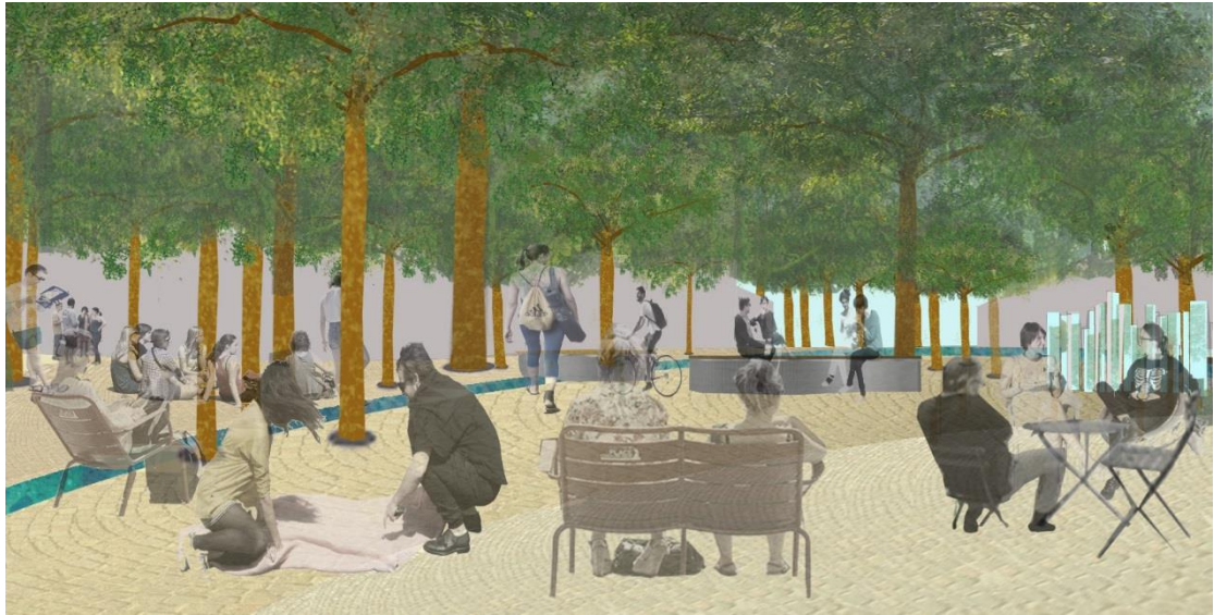
ככר מרכזית עיר ימים- הדמייה