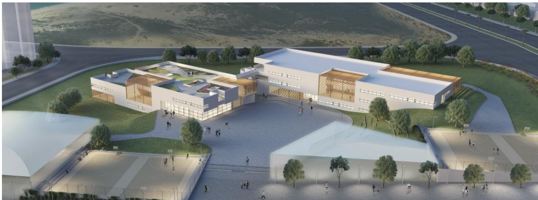
תיכון שש שנתני- עיר ימים- הדמייה