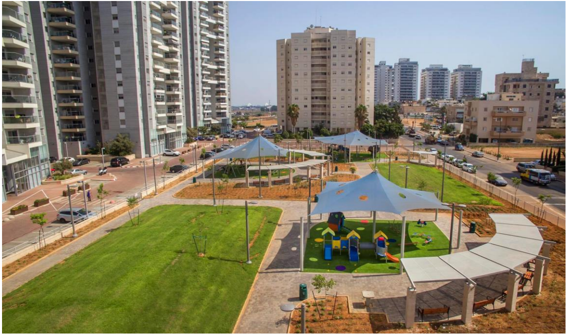
פיתוח שצ"פ בשכונת רמת חן- מתחם "טרינו"