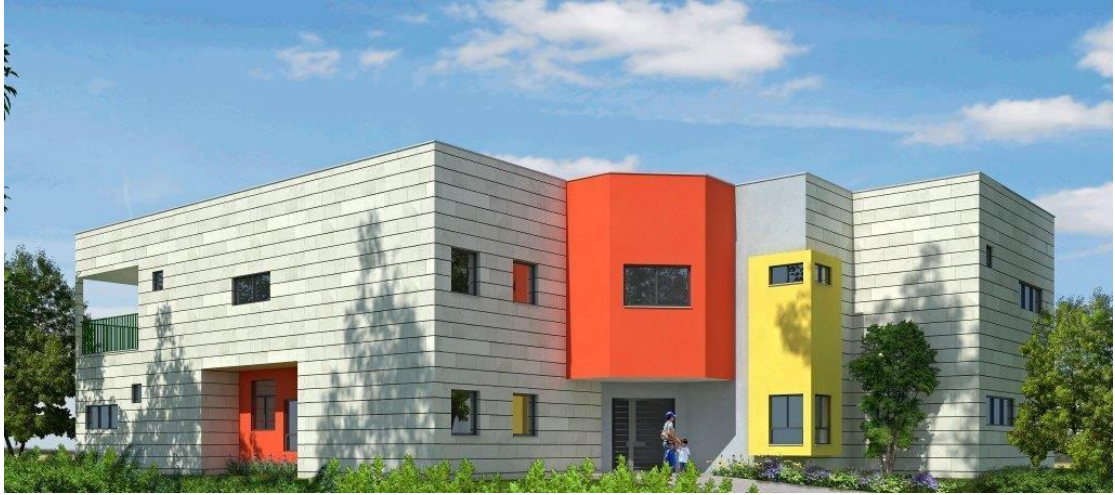
מעון יום בצפון העיר הדמייה