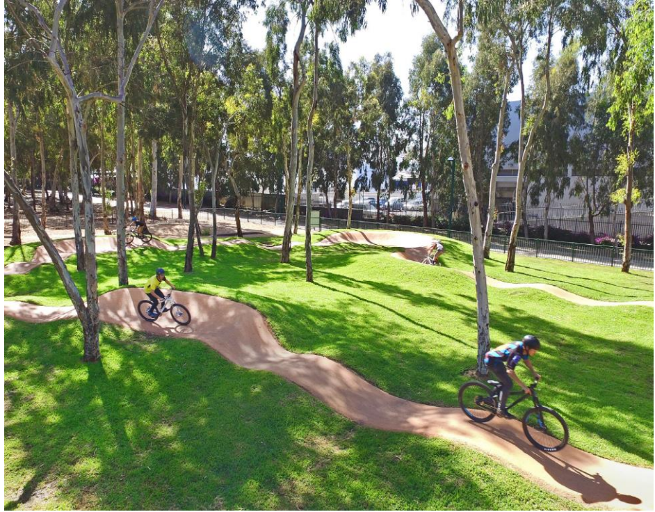
פארק אופניים- מזרח נתניה