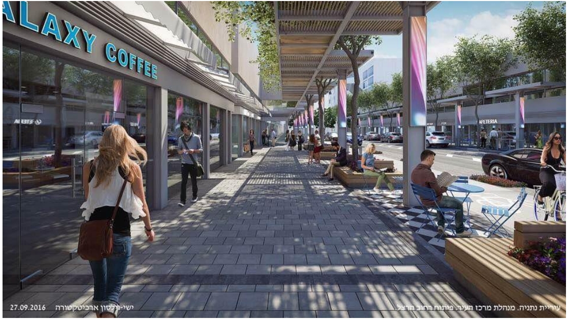
שדרוג רחוב הרצל- הדמיה