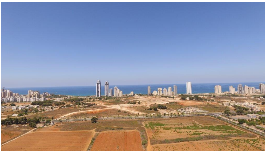
תחילת העבודות במתחם נת 542 א'