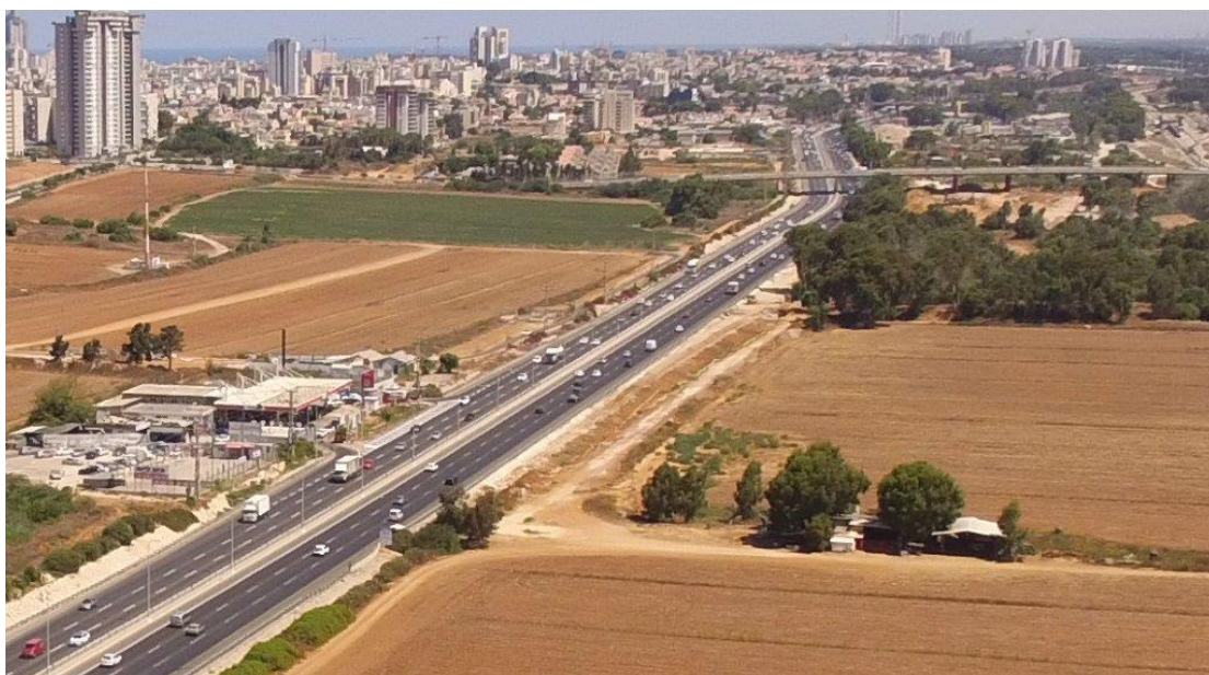
רמפה גשר האחדות-תחילת עבודות